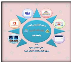
غلاف الدليل الإلكتروني

1. وقمنا بنشره وتعميمه للطلاب، على البوابة الإلكترونية للكلية، وعلى صفحة الفيس بوك لاتحاد طلاب كلية التربية، وعلى مجموعات الواتساب الخاصة بالفرق والشعب، و قد كان للدليل أثر فعال مع الطلبة.